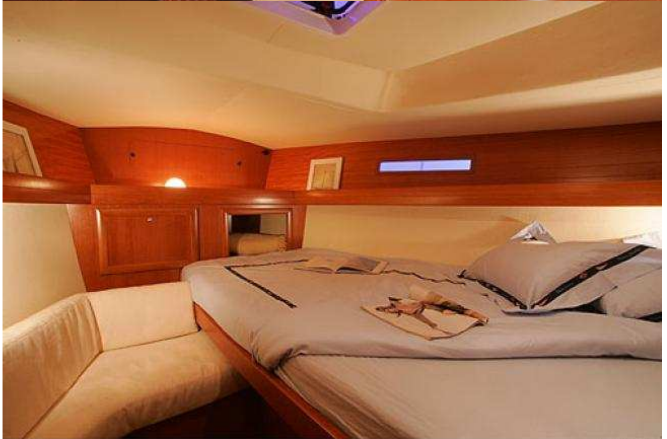
Dufour 365 Photo © Jean-Marie LIOT (mention obligatoire)

www.jmlot.com 00 33 (0)2 97 53 85 45 00 33 (0)6 80 20 27 95